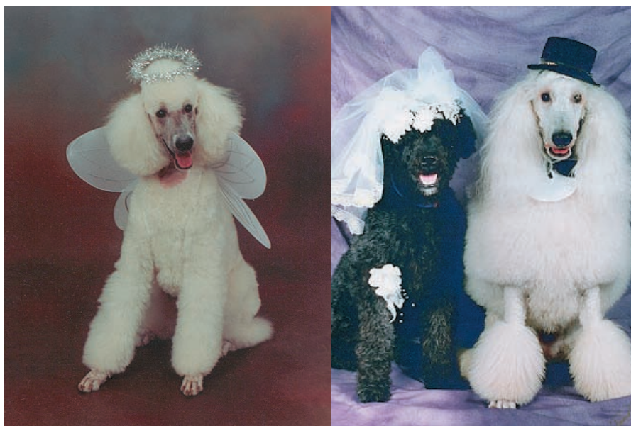
Amusant ou avilissant?