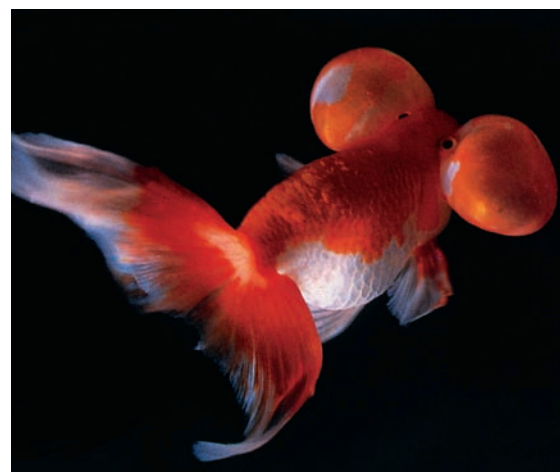
Les poissons rouges dits «poissons aux yeux protubérants», issus d'un élevage forcé, ont les yeux agrandis et tournés vers le haut. Dessous, on constate des excroissances à peau fine emplies de liquide, pouvant atteindre la taille d'un œuf de pigeon. La vue du poisson est de ce fait très réduite.

La majorité des membres des deux commissions estime que les contraintes imposées aux animaux selon différents critères (maux, souffrances, états d'anxiété, dommages, intervention modifiant l'apparence, avilissement et instrumentalisation abusive) représentent une atteinte à la dignité de la créature. Une pondération des intérêts en présence pourra éventuellement démontrer qu'une atteinte à la dignité peut se justifier lorsque les intérêts de l'homme ont été jugés plus importants que les intérêts de l'animal. La dignité de l'animal est considérée comme étant respectée dès lors que dans le cadre d'une pondération des intérêts soigneusement effectuée, l'atteinte qui lui est portée a pu faire l'objet d'une justification. En revanche, on considère que l'intervention prévue ne respecte pas la dignité de l'animal lorsqu'une pondération des intérêts en présence a conclu que les intérêts de l'animal ont plus de poids que les intérêts qui lui sont opposés.