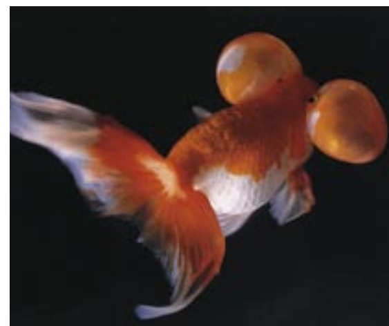
Bei der hochgezüchteten Goldfischrasse «Blasenaugen» sind die Augen vergrössert und nach oben gedreht. Darunter liegen dünnhäutige, mit Flüssigkeit ausgefüllte Ausstülpungen bis maximal Taubeneigrösse. Die Sicht der Tiere ist wesentlich eingeschränkt.

In den wenigsten Fällen liegt eine einheitliche Interessengewichtung und damit ein zwingend sich ergebendes Resultat der Güterabwägung vor. In beiden Kommissionen besteht jedoch Einstimmigkeit hinsichtlich eines generellen Verbotes der Herstellung von gentechnisch veränderten Heim-, Hobby- und Sporttieren sowie von Tieren allein zur Steigerung der Produktion von