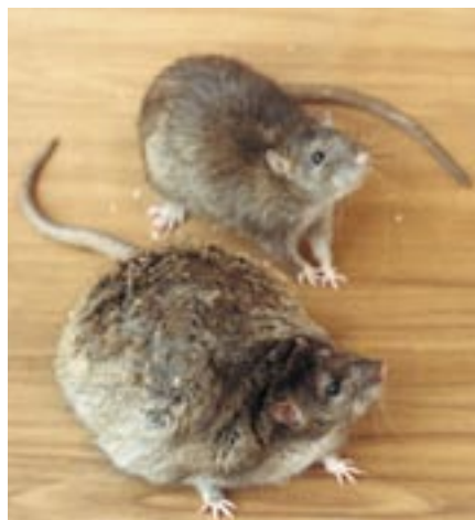
Diese durch eine natürliche Veränderung eines Gens (Mutation) entstandene «Fettratte» wird in der Forschung eingesetzt. Sie wird mit zunehmendem Alter so dick, dass der Tierpfleger oder die Tierpflegerin sie wenden muss, wenn sie zufällig auf den Rücken fällt.