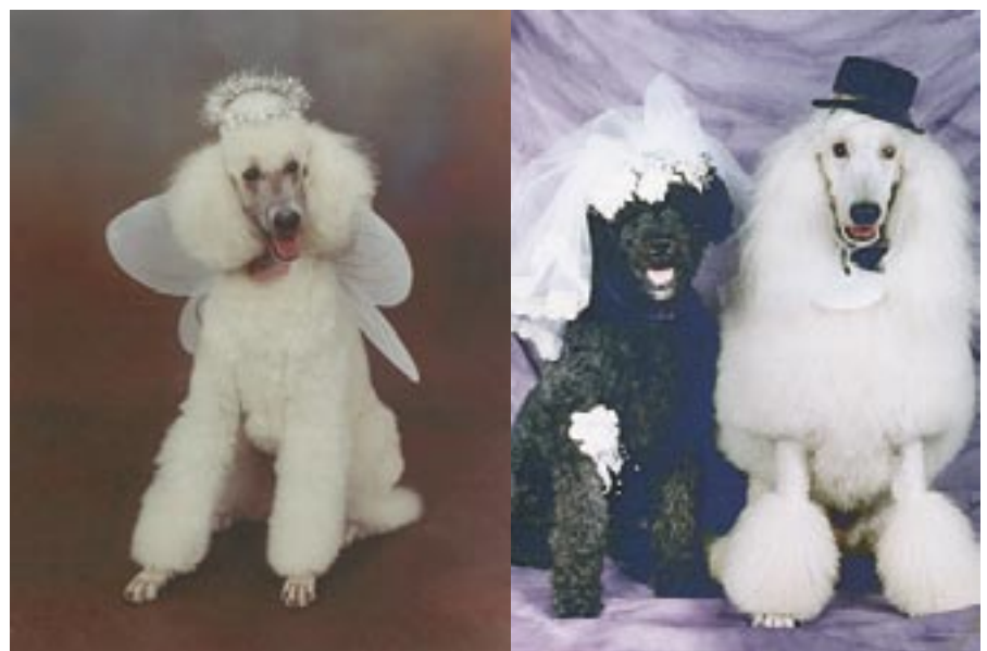
Lustig oder entwürdigend?