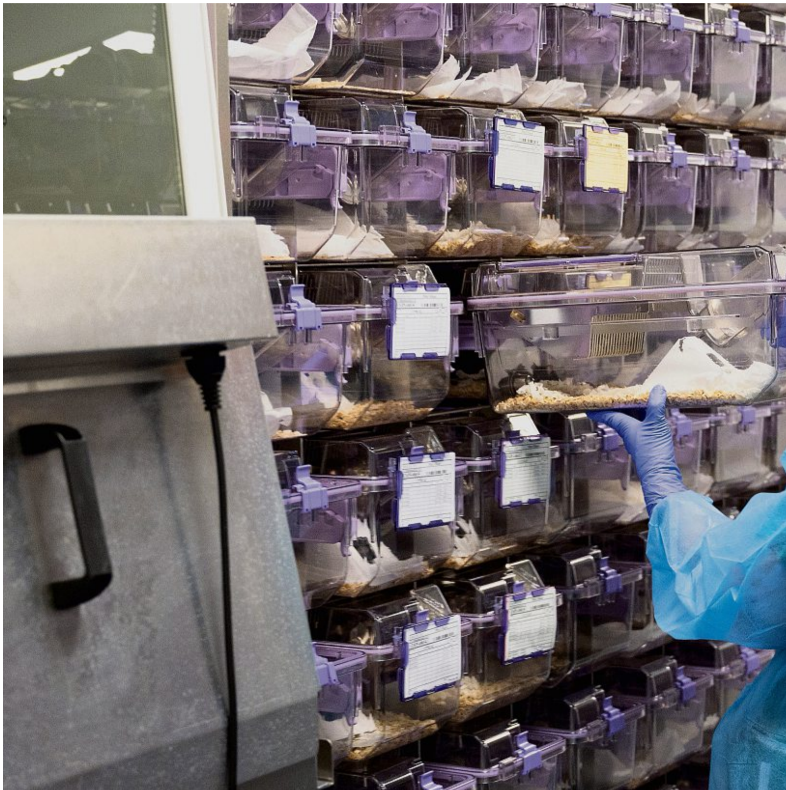
Die Käfige für Labornager sind steril und standardisiert, so wie hier in einer Tierversuchshaltung in der Westschweiz.

Humanere Tötungsmethoden gibt es schon heute, zum Beispiel